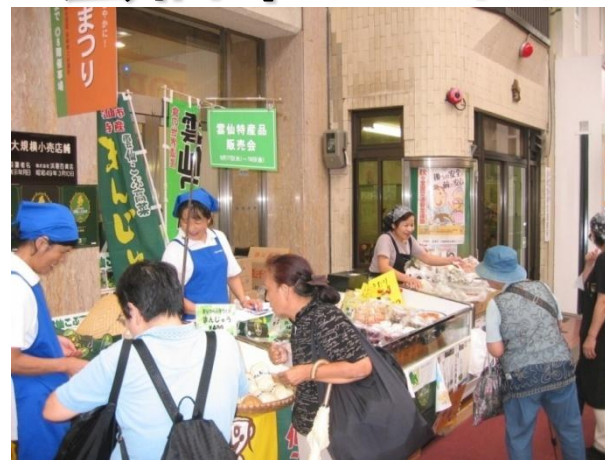
長崎浜屋県産品祭り