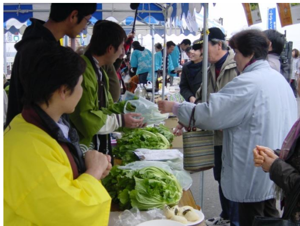
小浜温泉あったか冬まつり