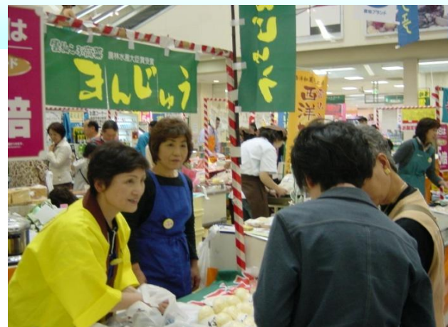
雲仙市フードフェア