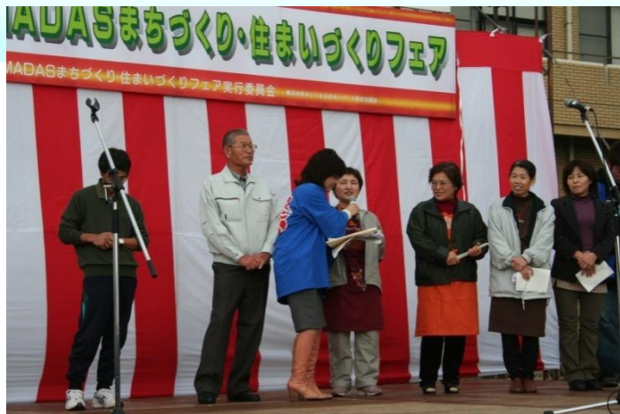
雲仙市産業まつり